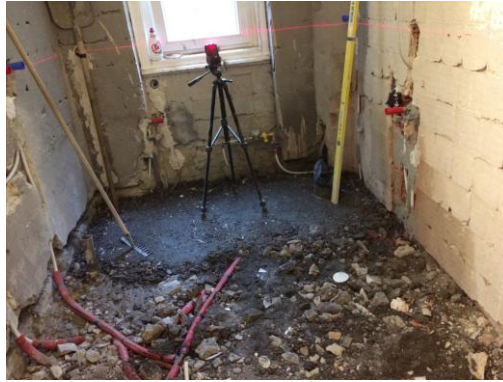
lakásfelújítás Budapest bontás