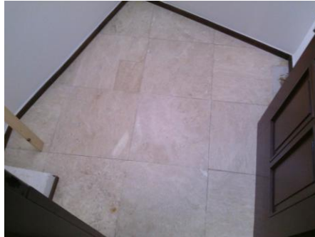
lakásfelújítás Budapest burkolás