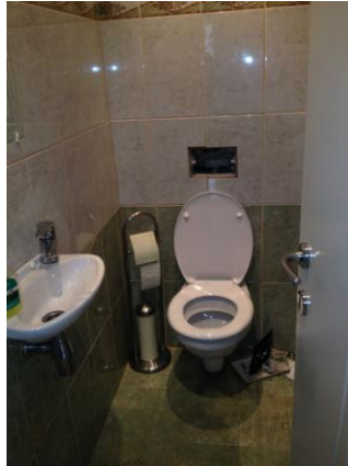
lakásfelújítás Budapest vízszereelés