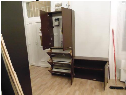
lakásfelújítás Budapest villanyszerelés